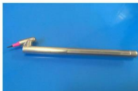
شکل شماره ۱. مداد ارگونومیک طراحی شده